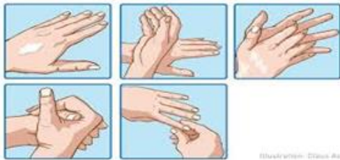
Illustration: ©Dana Aal B3